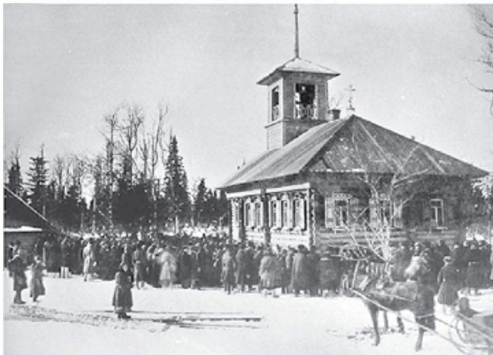
Свято-Никольский храм в 1894 г.